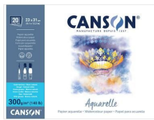
Blocks - Rough grain