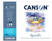
Blocchi collati 4 lati - Grana ruvida