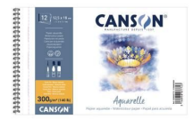
Album spirali - Grana fine