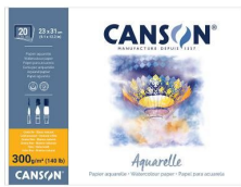
Blocks - Cold pressed