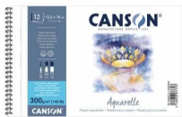
Album spirali - Grana ruvida