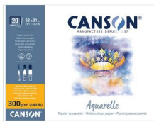
Blocchi collati 4 lati - Grana fine