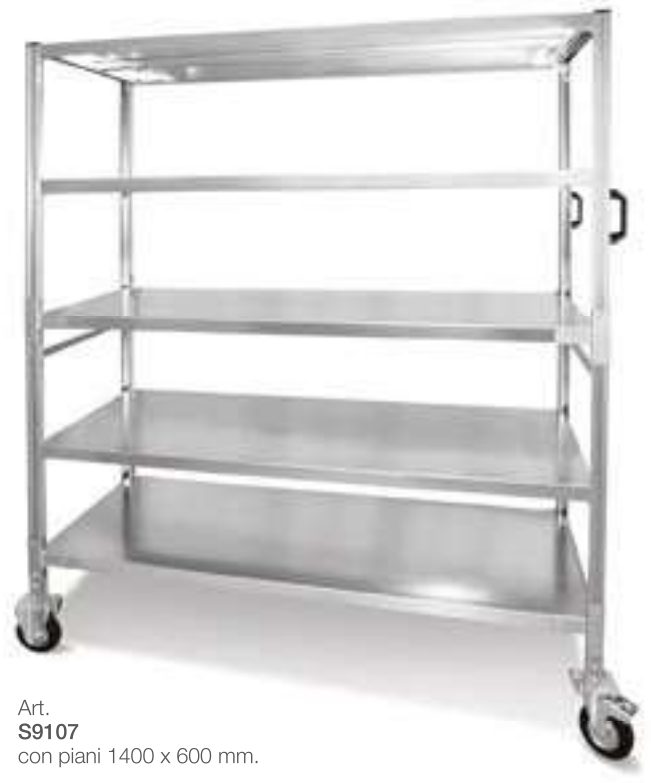
Art. S9107 con piani 1400 x 600 mm.

plus Chiedi al nostro ufficio tecnico per configurarlo secondo le tue esigenze.