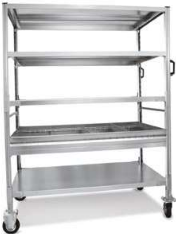
Art. S9106 con piani 1200 x 600 mm.

Realizzati con le scaffalature a gancio di pag. 218, permettono di regolare e aumentare il numero dei ripiani a piacimento.